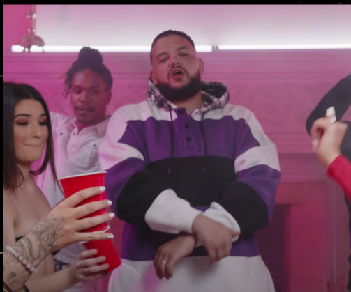
SADEK 'Y'EN A'