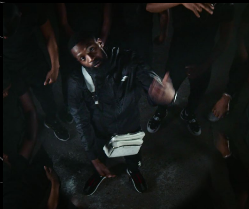
DA UZI 'BOYS BAND'